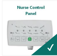
Panou de comandă la picioare