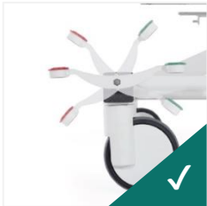
Role cu frână 150mm