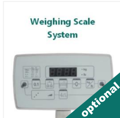
Sistem de cântărire