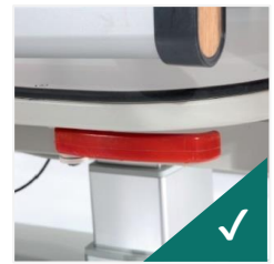
CPR manual dublu la spătar