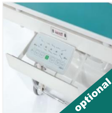
Raft pentru asistentă