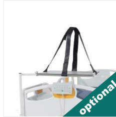
Raft pentru defibrilator