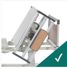
Spătar transparent raze X HPL