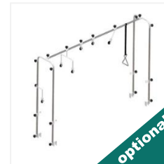
Sistem tracțiune ortopedi