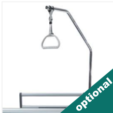
Stâlp pentru ridicare