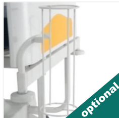
Suport cilindru oxigen