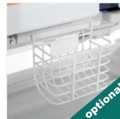
Suport pungă urină